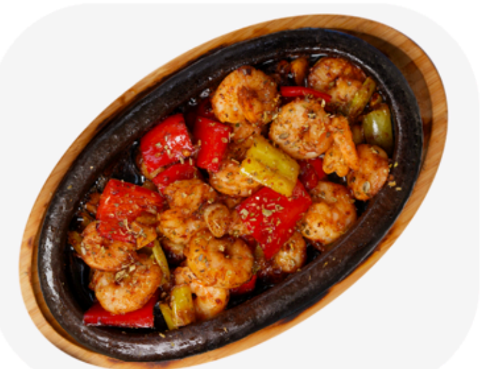
₺ 450 TEREYAĞINDA KARİDES Shrimp in butter

Fiyat güncelleme tarihi: Fiyatlara tüm vergiler dahildir.