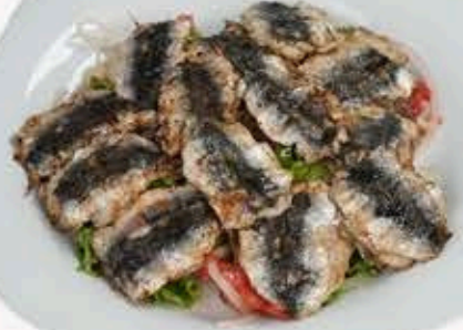
SARDALYA IZGARA Sardine