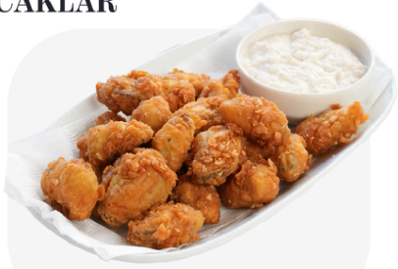
₺ 450 MİDYE TAVA Fried mussels