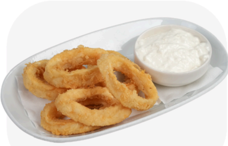
₺ 500 KALAMAR TAVA Fried calamari