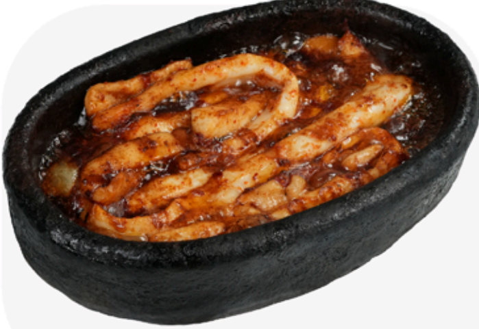
₺ 500 KALAMAR IZGARA Grilled calamari