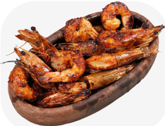
₺ 210 JUMBO KARİDES (Adet) Jumbo shrimp