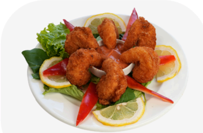
₺ 210 ÇITIR JUMPO PANE (Adet) Crispy Jumbo Breaded Shrimp