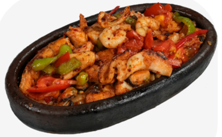
₺ 550 DENİZ MAHSÜLLERİ KAVURMA Roasted Seafood