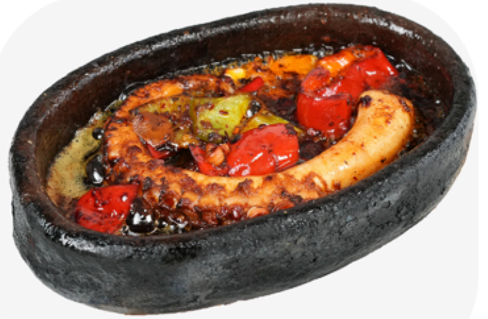
₺ 500 AHTAPOT IZGARA Grilled octopus